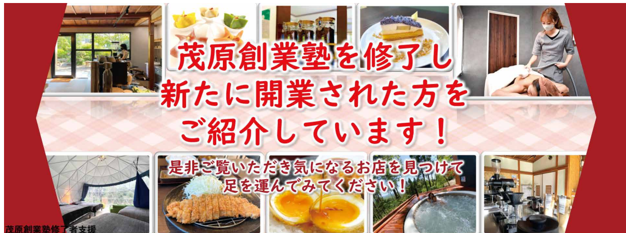
茂原創業塾修了者支援