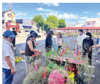
七夕竹飾り作成設置 (7月22日 実施)