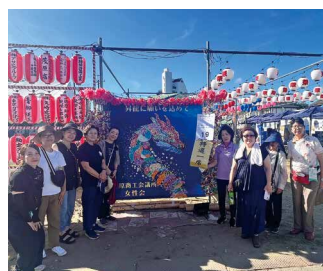
早朝ゴミ拾い参加時に フотスポットにて