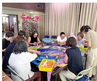
七夕飾り作成の様子 (7月14日 実施)