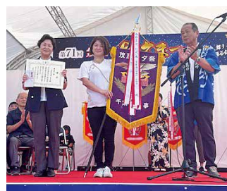
装飾コンクール表彰式の様子