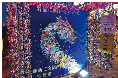
特選一席「千葉県知事賞」を受賞した作品