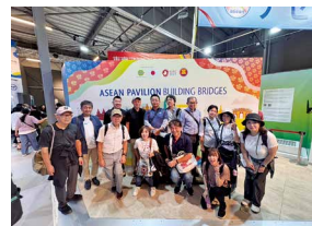
国際機関パビリオンでの集合写真