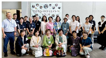
TOTOバスクリエイト株式会社見学班

各女性会が地域をPRする時間もあり、各地域への理解と交流を深める有意義な視察研修会となりました。