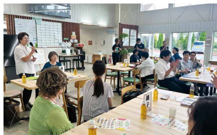
茂原市をご紹介します