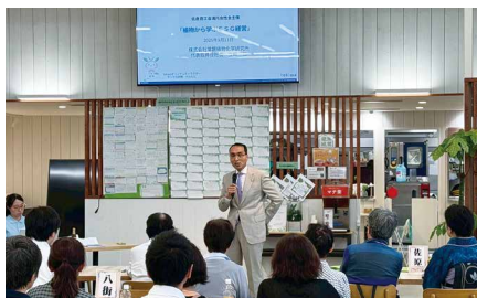
講演会の様子2 (植物に学ぶESG経営)