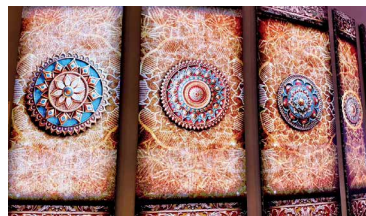
インドパビリオンの様子