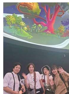
シンガポールパビリオンの様子