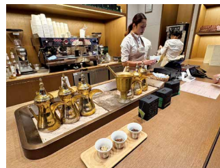
サウジアラビア王国パビリオンの様子