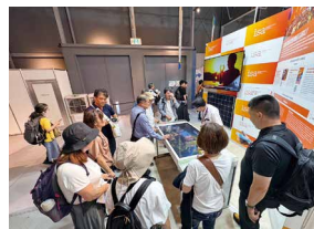
国際機関パビリオンの様子

館内では、「国際科学技術センター(ISTC)」より、映像やタッチパネルを使用したEU及び日本を含む9か国の取組や、「国際核融合エネルギー機構(ITER)」による核融合炉の模型やCG映像により、未来のエネルギーの仕組みを解説していました。